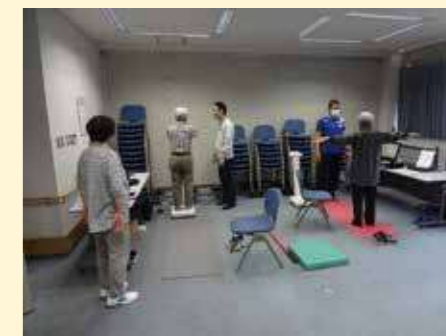
身体のゆがみ測定

いろいろな場所でさまざまな活動が行われています。関心のある方は、ぜひお立ち寄りください。