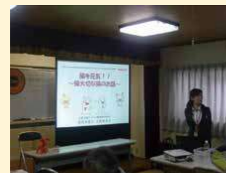
ヤクルトより「腸を元氣」についてのお話